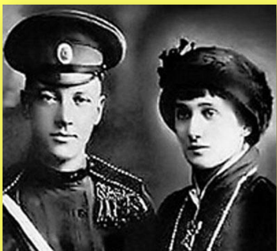
Николай Гумилёв и Анна Ахматова

Гумилёв не обычный поэт, каких было великое множество, он был еще и воином, путешественником и личностью, которая стойко и планомерно совершенствовала себя и свое творчество. Поэт для поэтов, методист литературного слога, создававший «цеха поэзии» основоположник акмеизма, литературного течения призывающий к сохранению литературных традиций Пушкина и Лермонтова. Жизнь и творчество Николая Степановича Гумилева являет нам ярчайший пример Человека и Гражданина, который может стать основой для воспитания новых граждан.