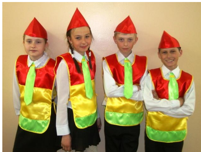
Команда перед «боем»

И вот настал этот день - день слёта. На школьном автобусе в сопровождении