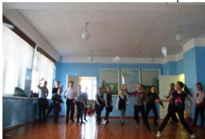
Соревнования в разгаре