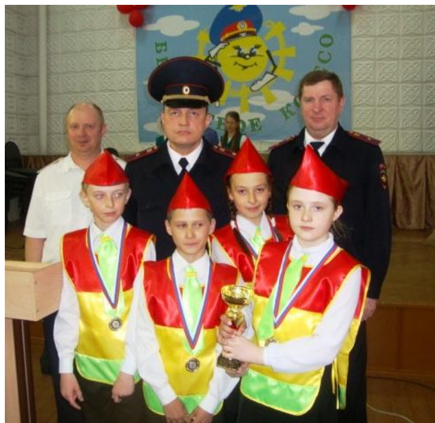
«Награда нашла героев»

При выступлении с агитпрограммой стало понятно, что призовое место в этой номинации должны завоевать, потому что выступили великолепно, без запинки, уложились во времени (что было немаловажно), и жюри не скрывали своего восторга. Пришло время награждений, и каково же было радостное удивление наших «Светофориков», когда их называли среди победителей в разных конкурсах, и тем более, когда объявили, что у них второе место в районе! Первое место было у хозяев слёта - команды «Вихоревской СОШ №2» Ребятам подарили много подарков, медали и кубок. С нескрываемым удовольствием они фотографировались с членами жюри и по-детски радовались своей победе. Молодцы!