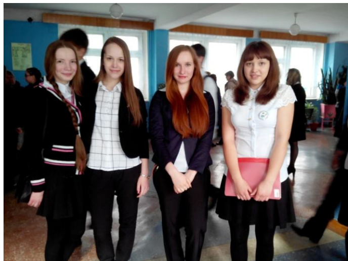
Женская часть команды