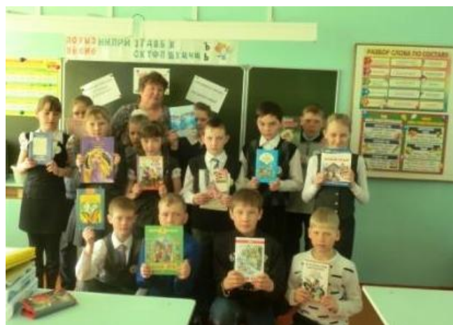
Четвёртый класс со своей идеей...

Это мероприятие поразило своей новизной и грандиозностью события. Единочасно читали в Братске и во всём Братском районе. Все были в восторге!