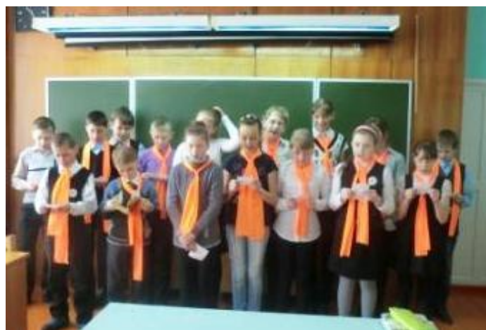
Пятый класс читают стихотворения С.Есенина

Второго апреля впервые в нашей школе состоялась флешмоб-акция «2015 секунд чтения». Ребята в своих классах совместно с учителями с 10-00 до 11-00 читали разные произведения. Каждый коллектив выбрал подходящий для себя вид чтения. Кто-то использовал выразительное чтение, чтение по ролям и др.