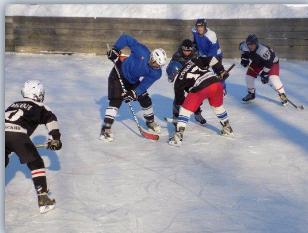
Игра в разгаре

5 марта в с. Ключи-Булак прошли соревнования по хоккею посвященные 70-летию хоккея в России.