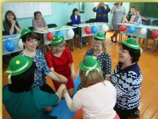
Строим геометрические фигуры