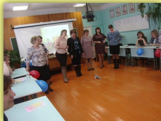
Катание куриного яйца с горки....