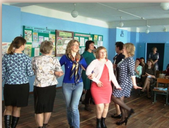
Кадриль по леоновски

В завершении мероприятия педагоги проанализировали представленный опыт работы и обменялись мнениями.