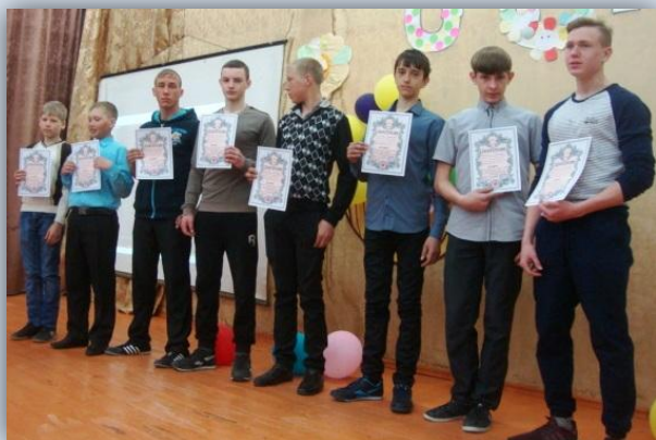
Вручение грамот команде на школьной линейке