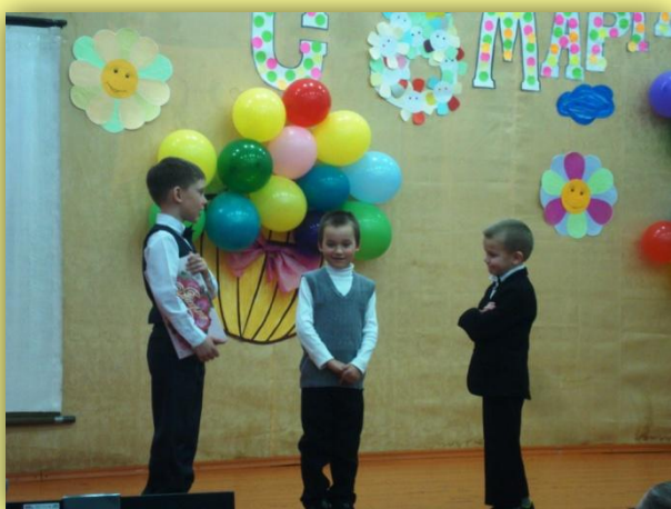
Первоклассники рассказывают о трудном характере девочек..