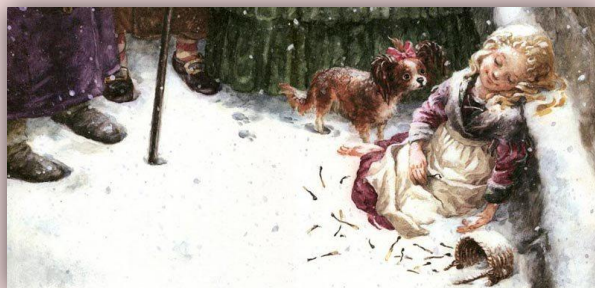
Иллюстрация к сказке «Девочка со спичками».