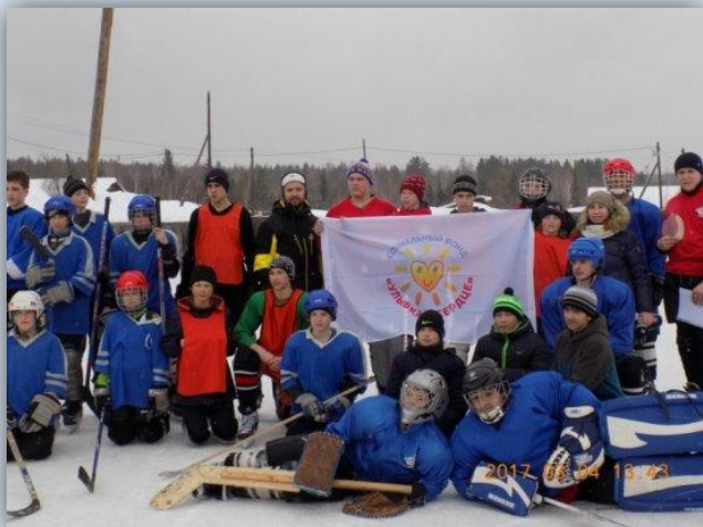
Наши хоккеисты под флагом

В чемпионате приняла участие хоккейная команда из Тангуя и заняла третье место. Победителем турнира стала хоккейная команда из Покосного, на втором месте – хоккеисты из Ключи-Булака . Все команды получили дипломы и денежное вознаграждение. Фонд "Улыбка в Сердце" решил сделать этот чемпионат по хоккею ежегодным.