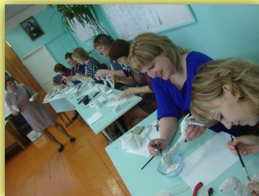
Изготовление объёмной игрушки