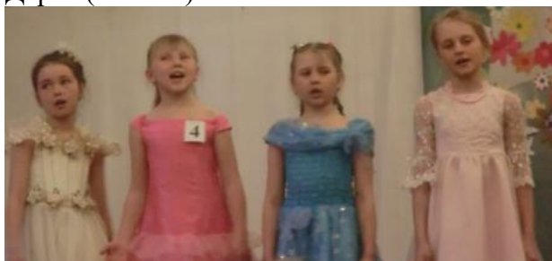
Юные исполнительницы 3 класса.