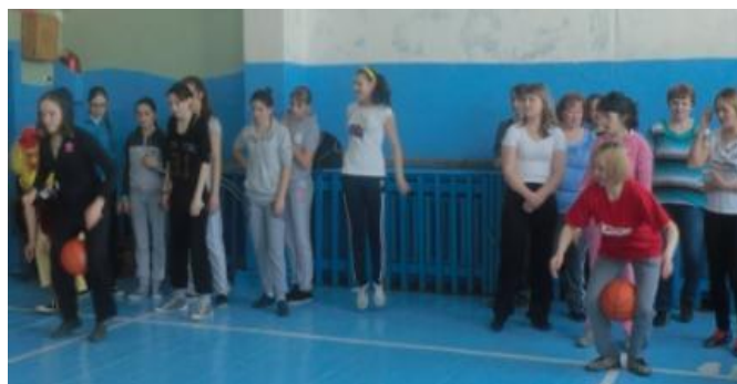
Один из конкурсов.