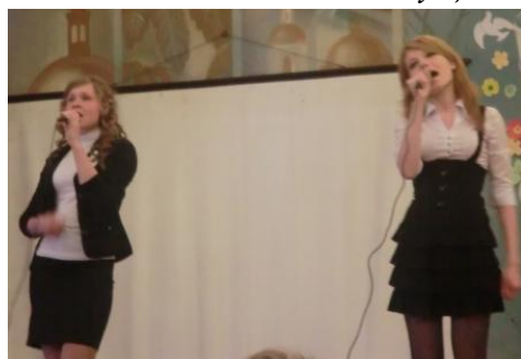
Дуэт из 11 класса