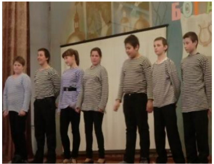
Богатыри 6 класса