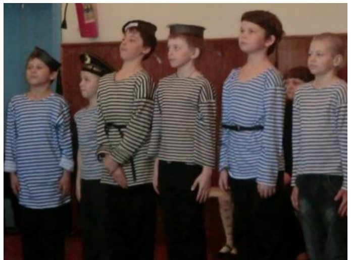
Юные бойцы 4 класса