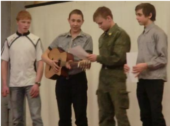
Армия восьмого класса

Представители своих классов должны были выступить, пока горит воображаемая спичка, показать свои умения в построении и маршировке, рассказать стихотворение и спеть песню на военную тематику (а вдруг пригодится?), написать письмо маме и танцевать танец «яблочко». А победили все – праздник же, пусть порадуемся!