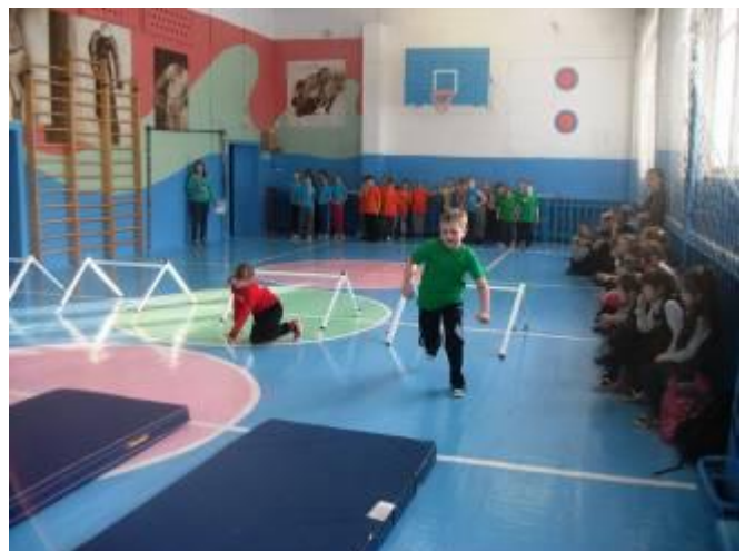
Соревнования в разгаре

А мы будем ждать следующих соревнований.