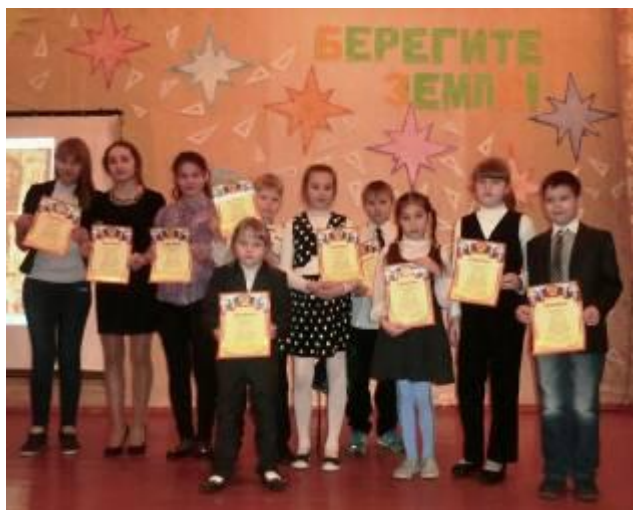
Победители конкурса чтецов