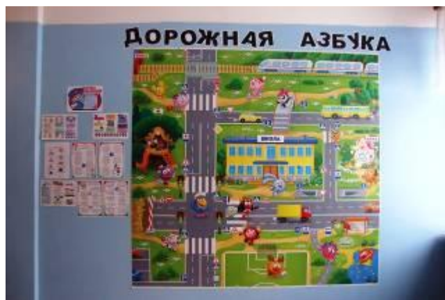
Стенд в младшем крыле по ПДД