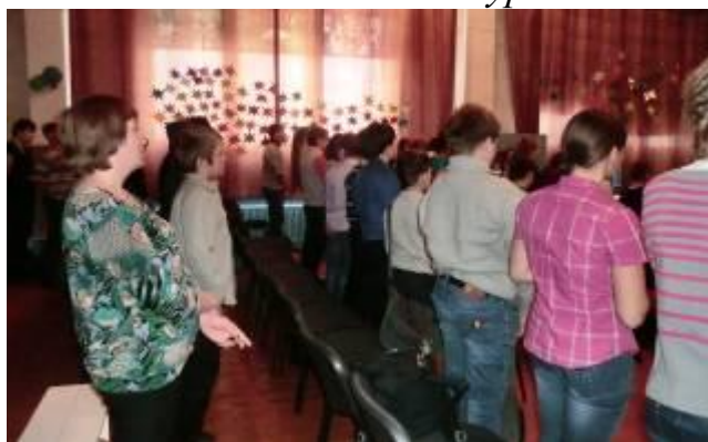
Минута молчания памяти жертв терроризма