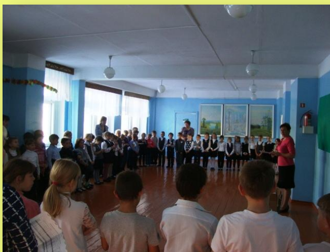
Линейка в начальном звене

В-третьих, назван был самый лучший класс по качеству обученности. Им оказался – 5 класс. Молодцы ребята! Вами гордится школа! В конце администрации школы было дано напутствие на вторую четверть, самую маленькую в учебном году.